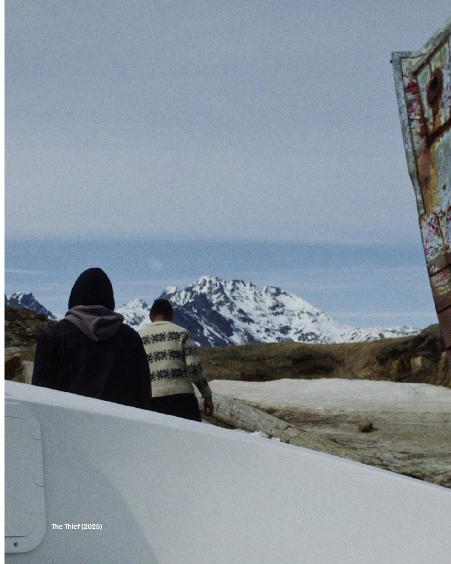
The Thief (2025)