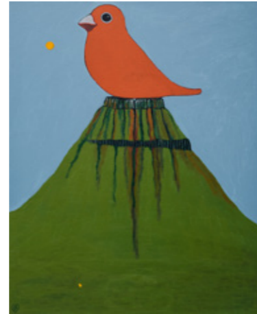
Udsigt / View