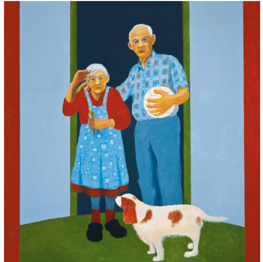
Liljerne / The Lilies

Sigrun Gunnarsdóttir's pictorial world is symbolic and incorporates elements of naïve art and Surrealism. The naïve and Surrealist traits concern the simplified renderings of figures, large fields of colour, and the use of clear contour lines around the figures. The various