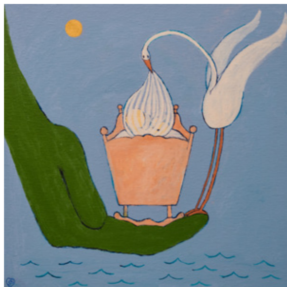
Velkommen / Welcome