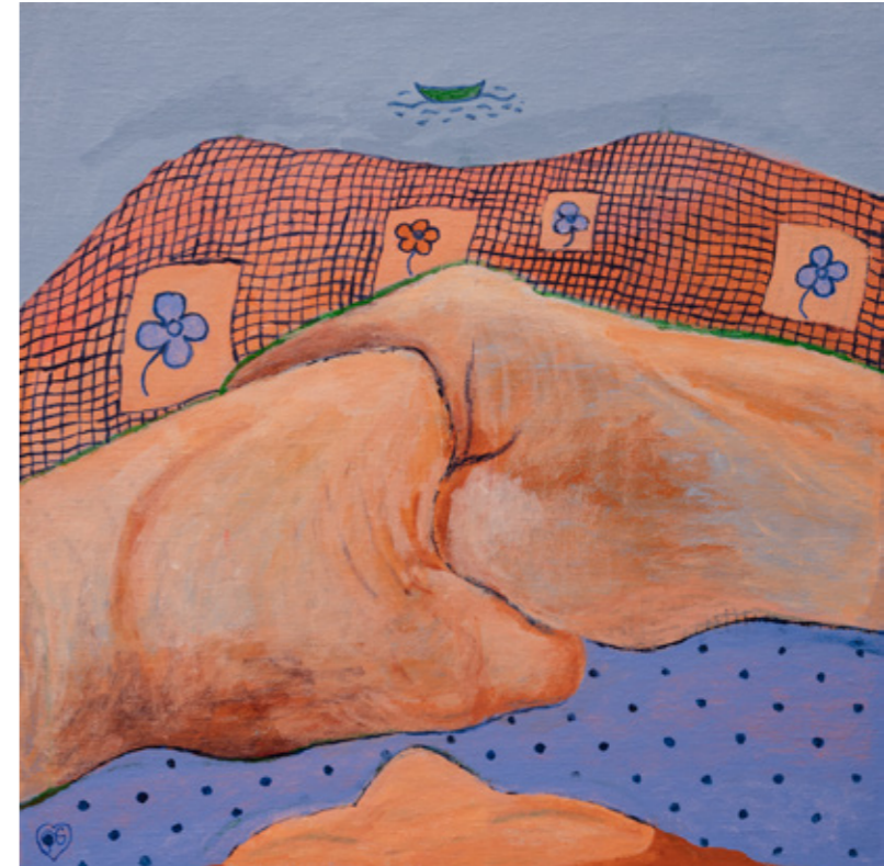
På havet / At sea