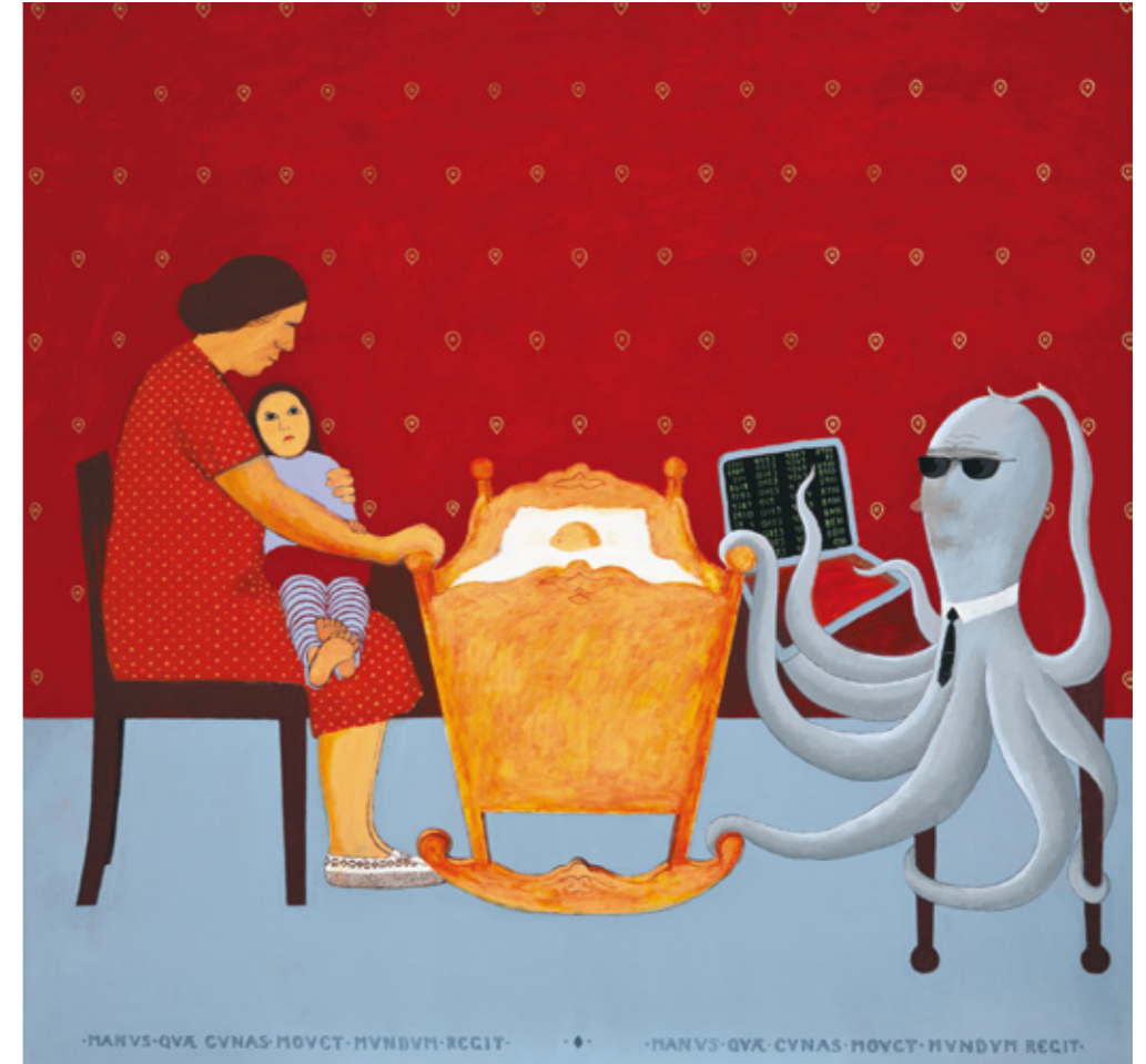
Den som rører vuggen styrer verden / The Hand that Moves the Cradle Rules the World