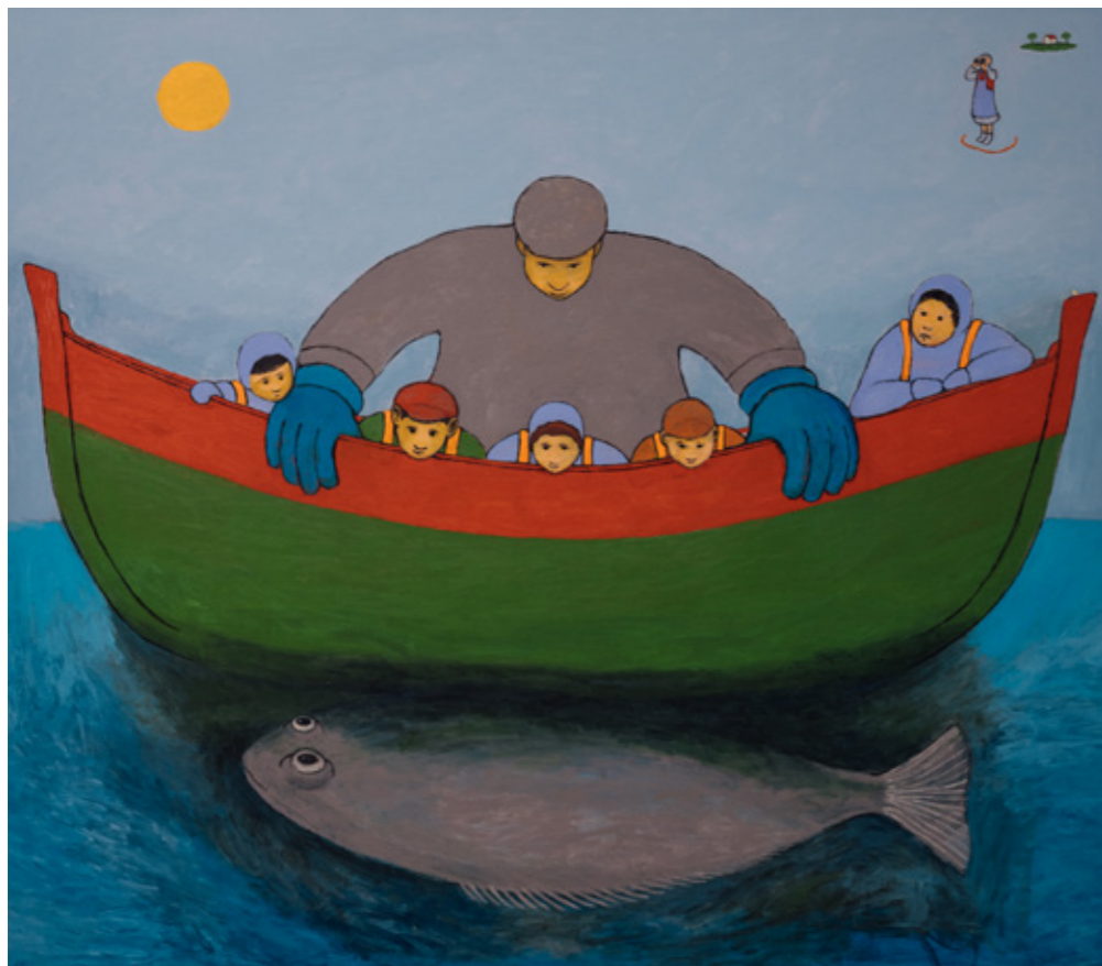
I bedstefars båd / In Grandfather's Boat