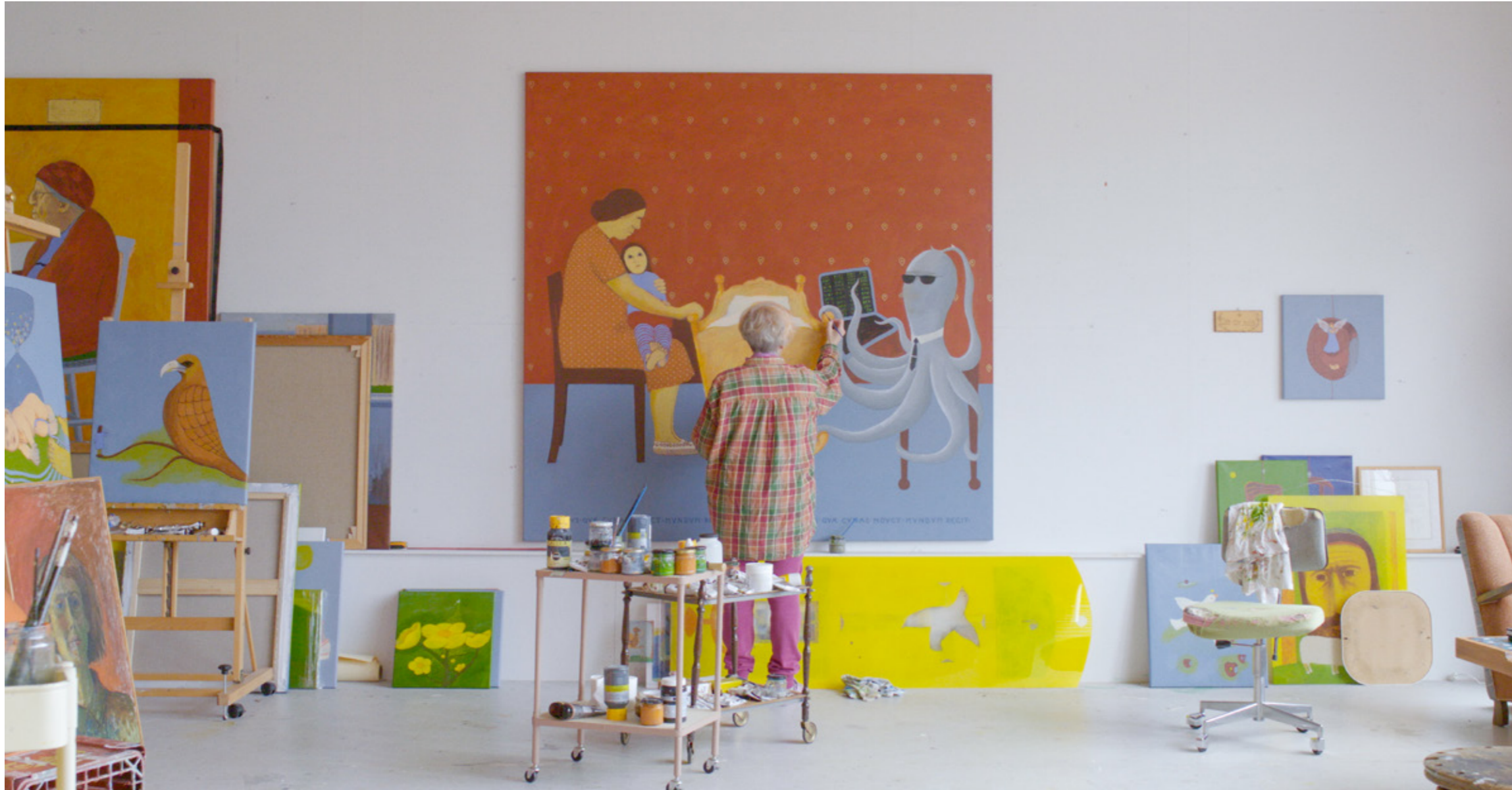
Sigrun Gunnarsdóttir i sit atelier / Sigrun Gunnarsdóttir in her studio