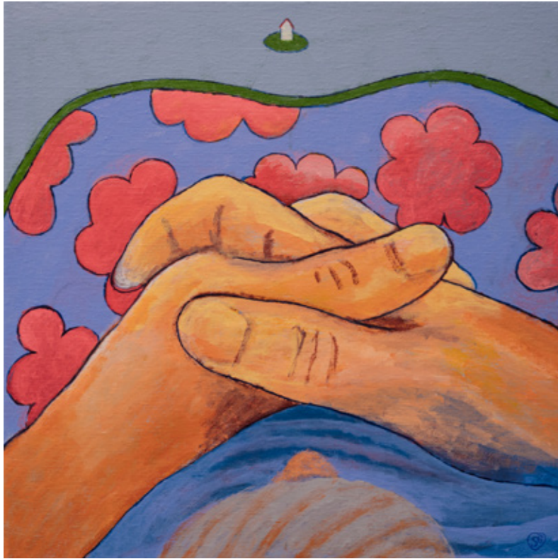
Omsorg / Care